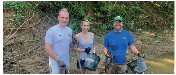
Nach dem Hochwasser wurde der Mühlgrabenbach gereinigt