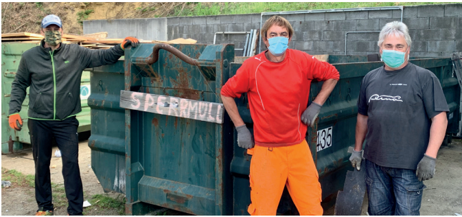
1. Sperrmüll nach Corona Lockdown