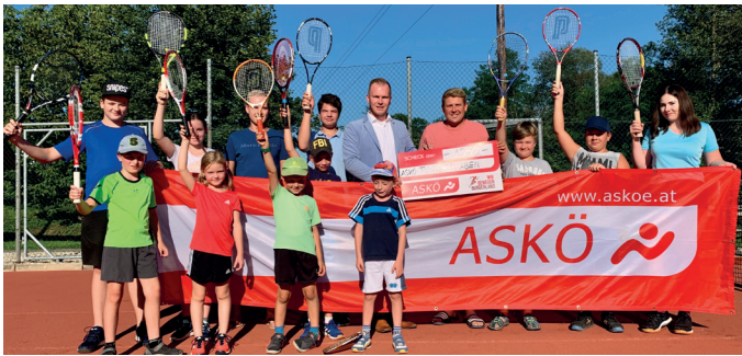
Ferienstpaß beim Tenniscamp