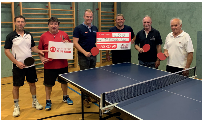
Scheckübergabe für die Initiative Sportverein PLUS: € 500,- Förderung des ASKÖ für ein erweitertes Bewegungsangebot.