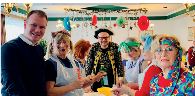
Fasching Februar 2020